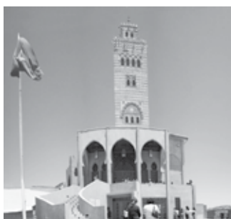
Mezquita, Coquimbo, Chile

Los alumnos observan distintas imágenes de construcciones que tienen fines comunes, pero que reflejan la diversidad cultural de Chile. Guiados por el docente, comentan las imágenes y concluyen que la diversidad de costumbres, celebraciones, construcciones, etc., tiene relación con el aporte de diversas culturas a nuestra identidad. A modo de ejemplo, se proponen imágenes de construcciones de la ciudad de Coquimbo, que reflejan la diversidad religiosa.