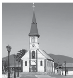
Iglesia Guayacán, Coquimbo, Chile